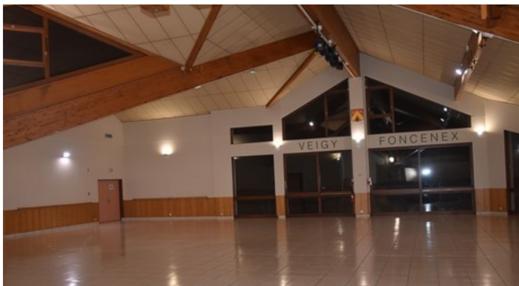
Dojo intérieur de l'ASL

Stage d'été aux 1000 Pouces du 7 au 14 juillet 2024.